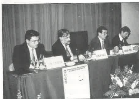
Sesión dedicada a los nuevos Principios de Organización y Sistemas