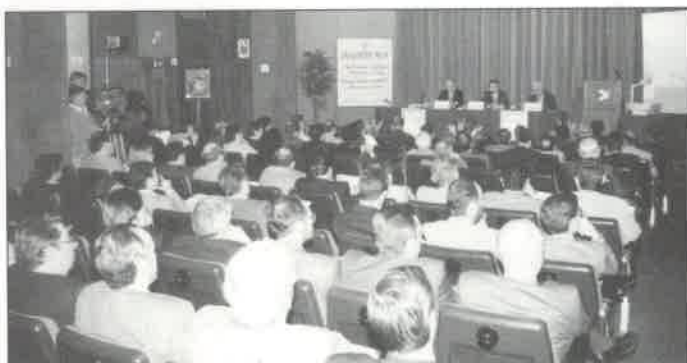
Acto de apertura del VII Encuentro AECA, presidido por Jaume Matas Palou , presidente de la Comunidad Autónoma y Gobierno de Baleares.

cial mención a las medidas tomadas para reducir el déficit público, principal variable económica, imprescindible de controlar para conseguir que España pueda cumplir con los requisitos de Maastrich y estar en la "primera fase" de la Unión Monetaria Europea. Reconoció que la adaptación de nuestro país a la senda del déficit de convergencia hubiera requerido que paulatinamente se hubieran abordado desde el primer momento las refor-