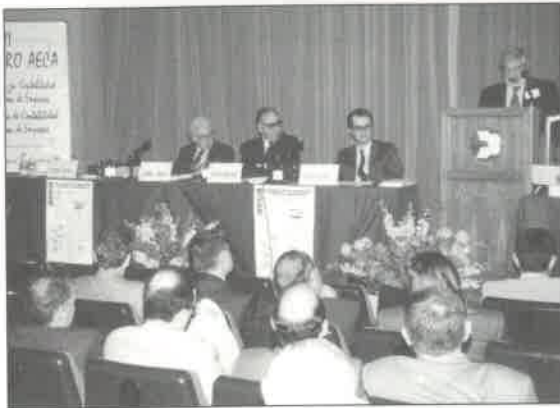
Sesión dedicada a la Historia de la Contabilidad

El éxito de participación y la excelente organización animan a los Encuentros de la Asociación a iniciar en Palma de Mallorca un recorrido por el archipiélago balear, que tendría su siguiente escala en la isla de Menorca ■