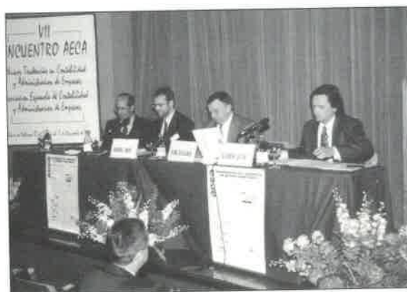
Sesión dedicada a los nuevos Principios de Contabilidad de Gestión

de la eficiencia de la empresa como nueva orientación de la dirección empresarial: la empresa con sus recursos y capacidades, personas y procesos deben responder al reto planteado por un entorno en continuo cambio y muy competitivo.