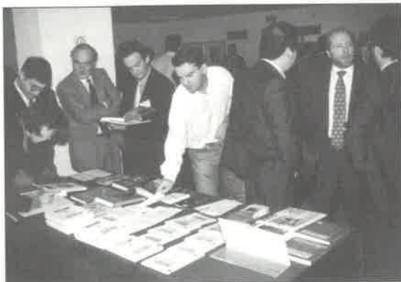
Exposición editorial del VII Encuentro AECA en la que participaron McGraw Hill, Deusto, Pirámide, AECA y AEDAF