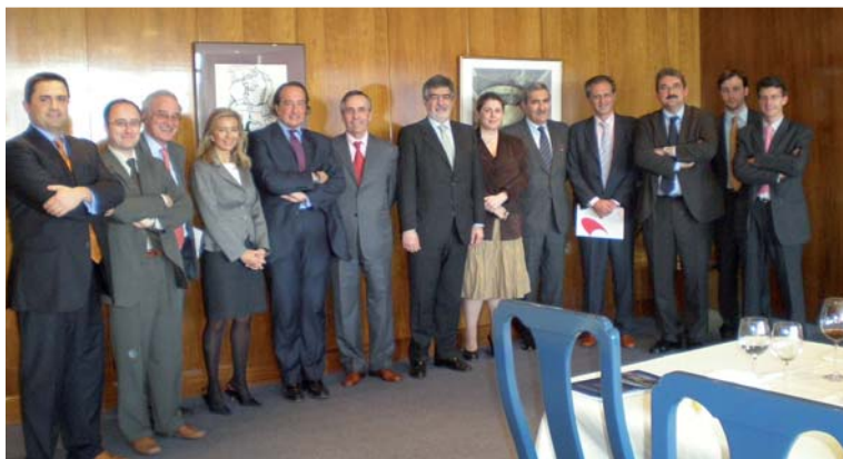
Jurado de la sexta edición del Premio

El hecho de concursar en la presente convocatoria supone la total aceptación de estas bases.