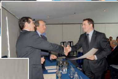
Algunos momentos de la Entrega de premios